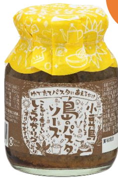
しょうゆガーリック