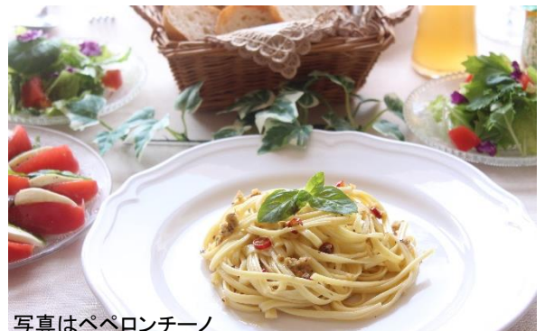
写真はペペロンチーノ

共栄食糧のパスタは、ゆで時間3分とお待たせしません！自慢の凸凹形状にソースがよく絡みつき、どんなソースも余すことなくおいしくいただけます！